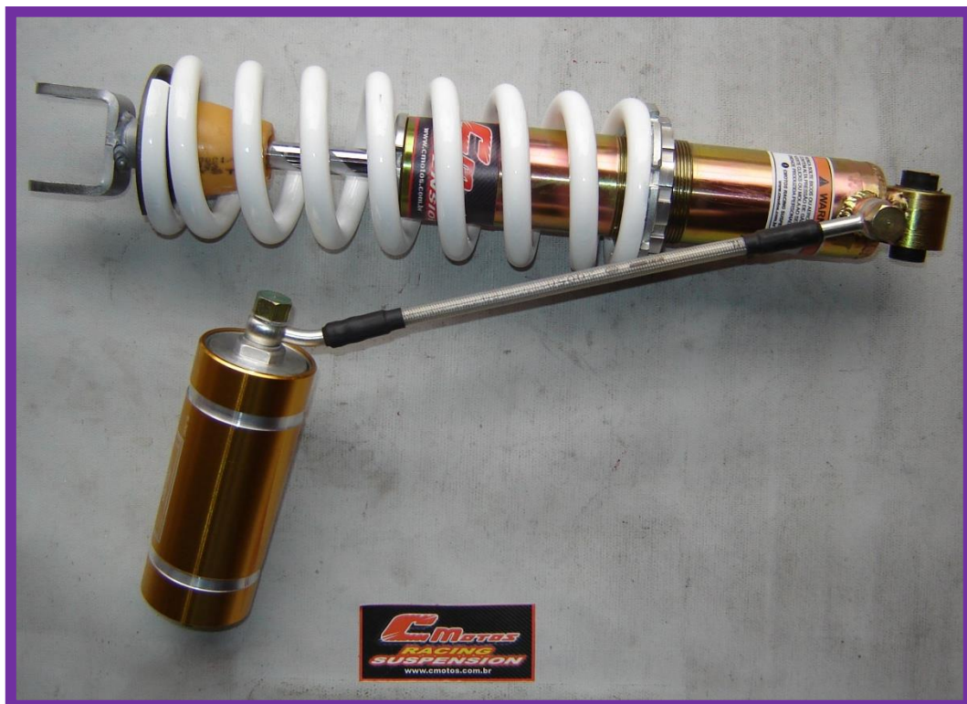
Novo profissional e com ajuste de mola