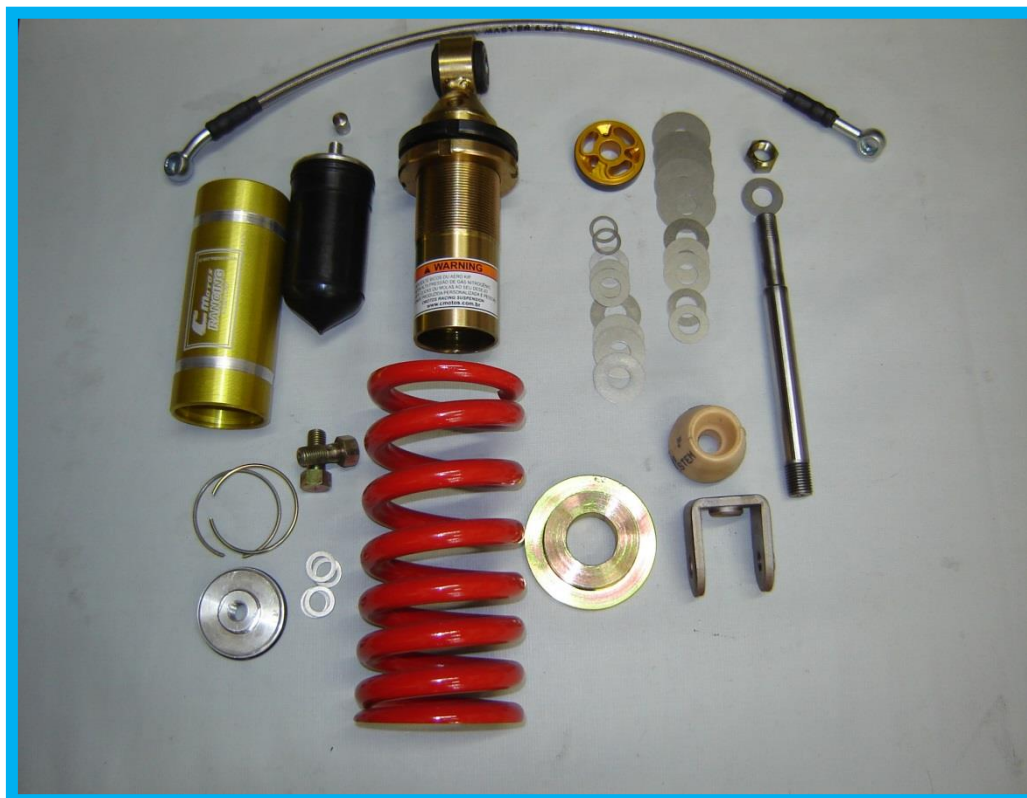
Acima foto do sistema sem cliques Amort .NOVO Cmotos