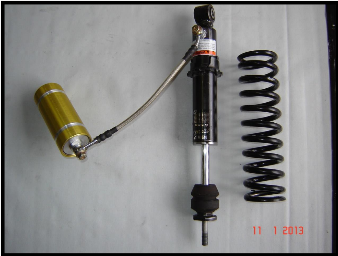
BMW GS 650 Preparado com garrafa de nitro e revalvulação